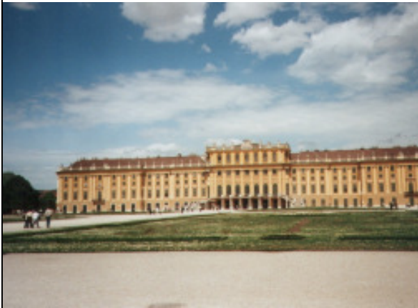
das Schloss Schönbrunn