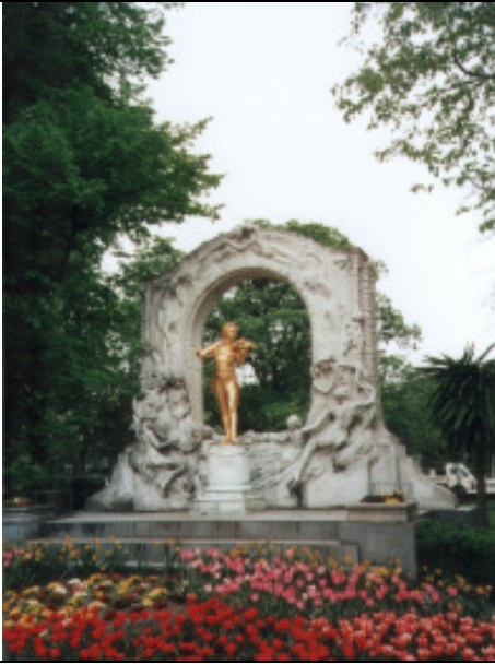
das Johann-Strauß- Denkmal (Stadtpark)