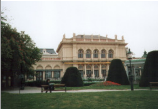
der Kursalon (Stadtspark)