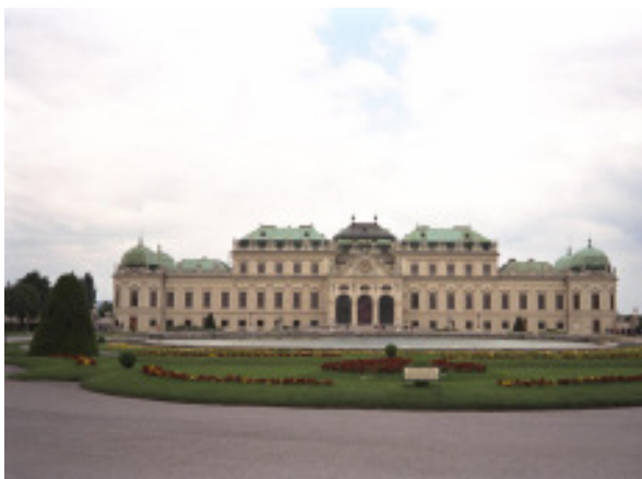
das Schloss Belvedere